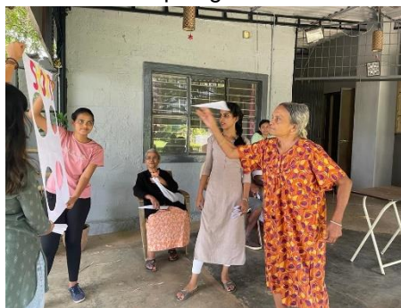
stage recreatieve activiteiten