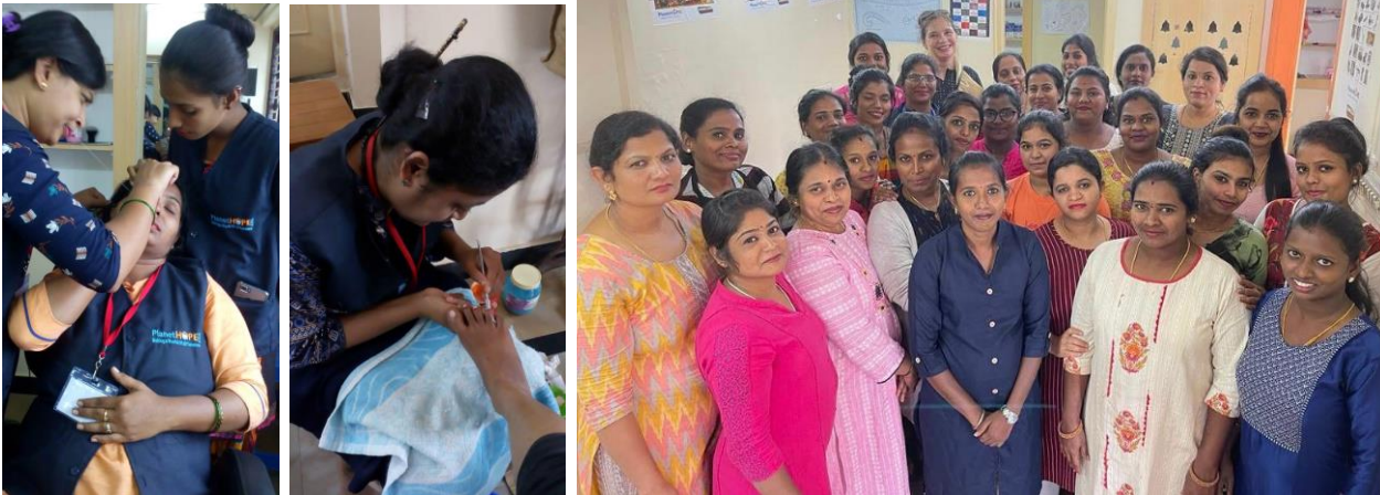
bij de studentes Beautician & Entrepreneurship.

In augustus 2022 is de nieuwe batch met 30 studenten gestart. Eind november 2022 heeft bestuurslid Karen Duys de opleiding bezocht en met de enthousiaste leerlingen gesproken. Ook sprak ze met afgestudeerde studentes die inmiddels aan het werk waren in een schoonheidssalon.