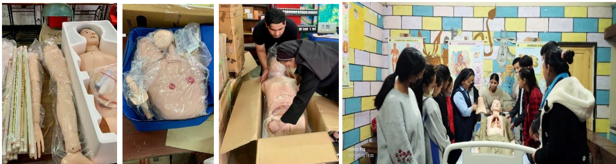
Met deze poppen hebben de studenten praktische vaardigheden kunnen oefenen voordat zij stage gingen lopen in een ziekenhuis en verpleeghuis.

De docenten van het ROC Mondriaan geven wekelijks online lessen. Het team van Indiase en Nederlandse leerkrachten hebben video interviewsessies om de opleiding zo goed mogelijk samen vorm te kunnen geven.