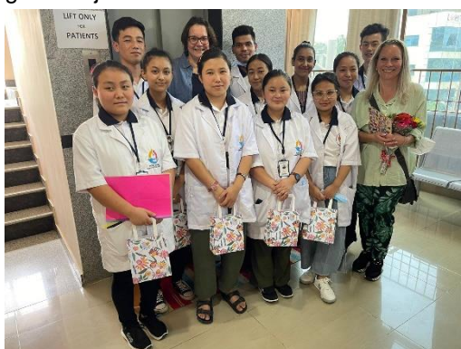
ROC Mondriaan aan studenten tijdens hun stages.

Het hele studiejaar hebben docenten van het ROC Mondriaan op vrijdagen online lessen gegeven op een interactieve wijze. Dit als aanvulling op de lessen gegeven door de Indiase docenten. Ook is aandacht besteed aan persoonlijke ontwikkeling en het verstevigen van de eigen waarde en geoefend met het aangeven van grenzen in de werkpraktijk. In mei 2022 hebben de docenten de studenten in India op vrijwillige basis bezocht op hun stageplekken. Het was een leerzaam en bijzonder bezoek. Een jaar lang ontmoette de studenten en docenten elkaar online en dit keer echt fysiek. De docenten kregen zo een goed beeld van de ouderenzorg in India en konden ter plekke nog nuttige tips aan de studenten geven. Ook gaven zij intervisiesessies aan de docenten.