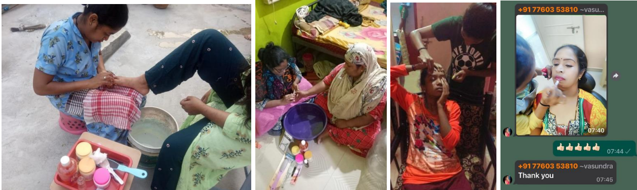
Thuis wordt druk geoefend en resultaten gedeeld in de whatsapp-group.

De studentes hebben ook veel opdrachten gekregen om thuis te oefenen. Er is een whatsappgroep aangemaakt waarin filmpjes en foto's werden gedeeld van behandelingen die zij aan familieleden en vrienden gaven. De docenten gaven feedback waar iedereen van kon leren.