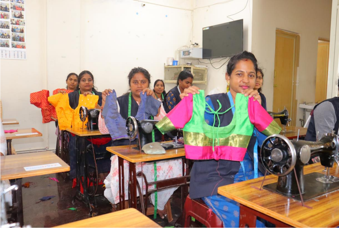
De eindopdrachten gemaakt door onze studenten.

De examens die de studentes afleggen bestaan uit een theoretisch deel en een praktisch deel. De kennis van de naaimachine, stoffen en werkmaterialen werden getest evenals de basiskennis van alles wat komt kijken bij het starten van een eigen bedrijf. Tijdens het praktijkexamen moeten de studenten een kledingstuk voor een klant maken. De klanten waren familieleden of mensen uit de buurt. Alle vaardigheden vanaf het opmeten van de maat, het kiezen van de juiste stof, aftekenen, knippen en naaien kwamen aan bod. De leraar beoordeelde het werk op snelheid en kwaliteit.