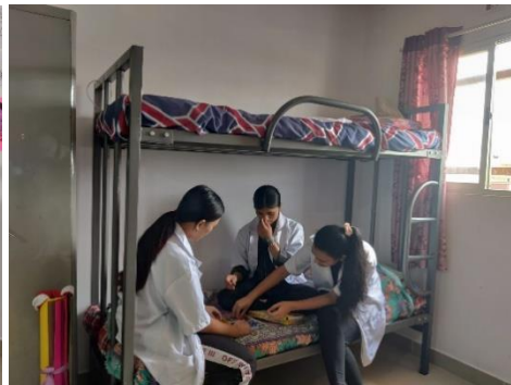
Slaapkamers met de mooie stapelbedden en kleurrijke lakens, gordijnen.

De opleiding is grotendeels gekoppeld aan de praktijk. Studenten lopen stage waar ze het vak in praktijksituaties leren. Ze volgen ook modules in de vorm van klassikale bijeenkomsten met veel praktijkvoorbeelden. Deze modules worden verzorgd door docenten die zelf in het veld werken. Dit maakt de lessen erg plezierig en zorgt ervoor dat de stof op een zeer herkenbare manier wordt uitgelegd.