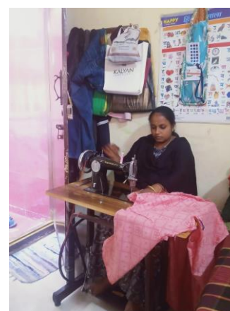
ondernemer vanuit huis aan de slag