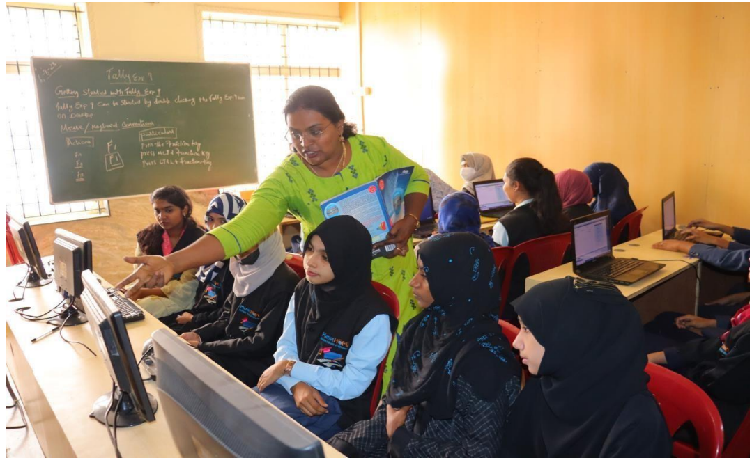
ICT opleiding Tally

Een ander initiatief dat we hebben gelanceerd is de opleiding Tally , een bekende Indiase boekhoudsoftware die goede carrièrekansen biedt. Deze cursus is specifiek gericht op meisjesstudenten uit lage-inkomensgezinnen in HBR Layout, Bangalore. Ondanks enkele uitdagingen, zoals persoonlijke problemen en leerachterstanden, hebben we 25 gemotiveerde studenten weten te behouden en met succes laten afstuderen. De toevoeging van een basiscomputer cursus module bleek cruciaal om hun basis vaardigheden te versterken.