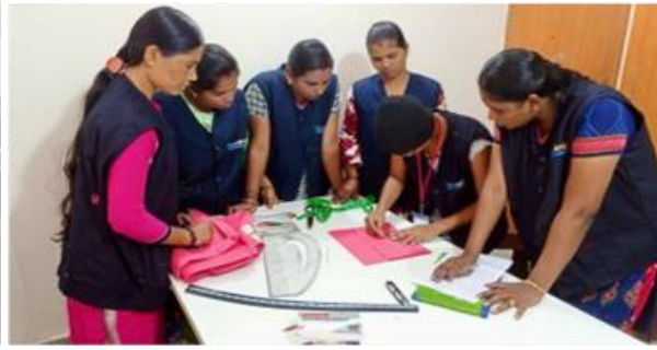
kledingmaten opmeten, patronen tekenen en stoffen knippen.