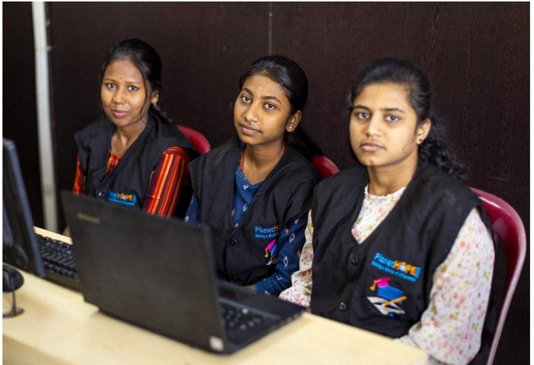
Met de ontwikkeling van computervaardigheden zijn de meiden op de toekomst voorbereid