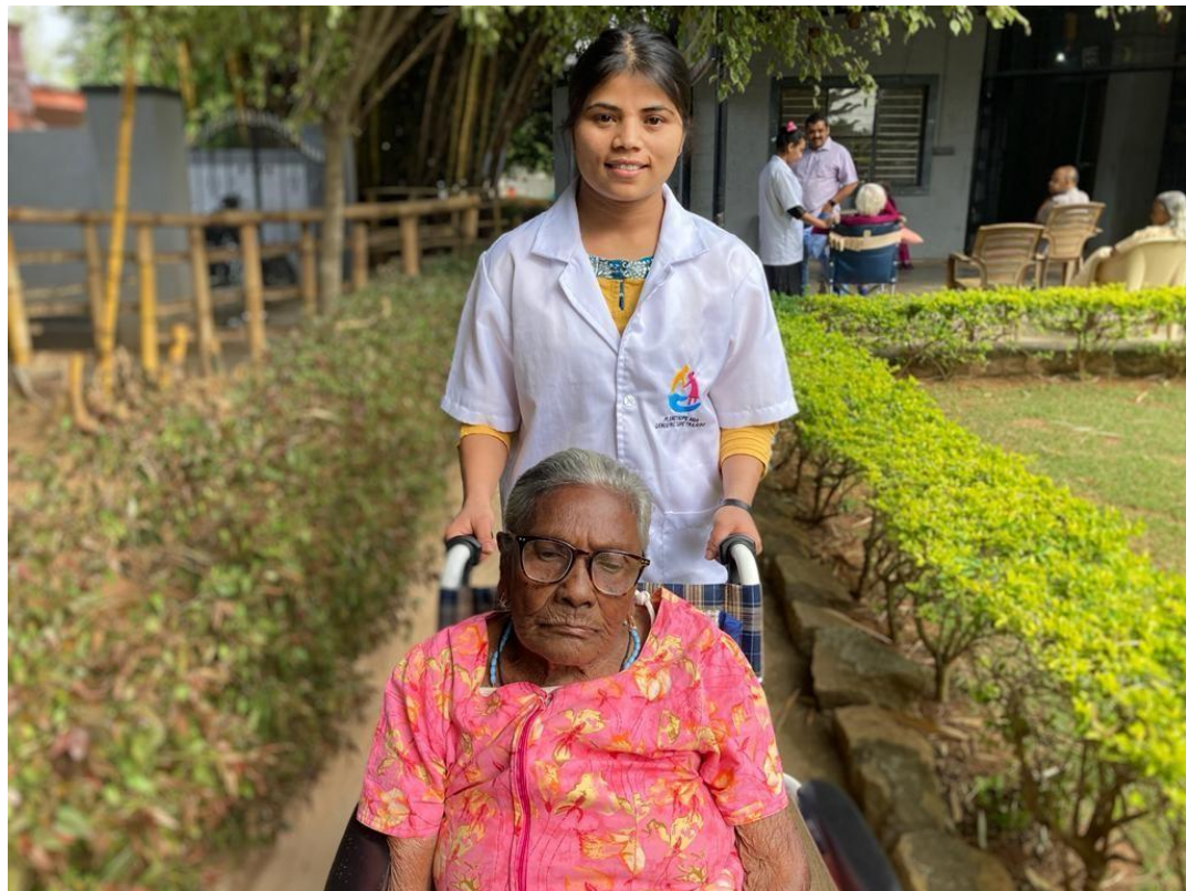
Voor ouderen zorgen bij Ashley Home Care

Als geheel zal deze opleiding Ouderenverzorging een aanzienlijke impact hebben op zowel de studenten, de ouderen die zij verzorgen, als de gemeenschappen, met verbeteringen op het gebied van zorgverlening, werkgelegenheid en empowerment van vrouwen.