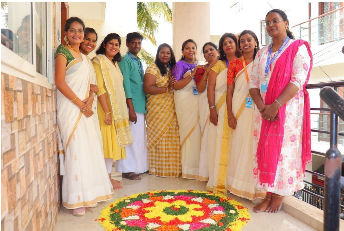
Team Planet Hope Asia

#Het bestuur van stichting Planet Hope & team India