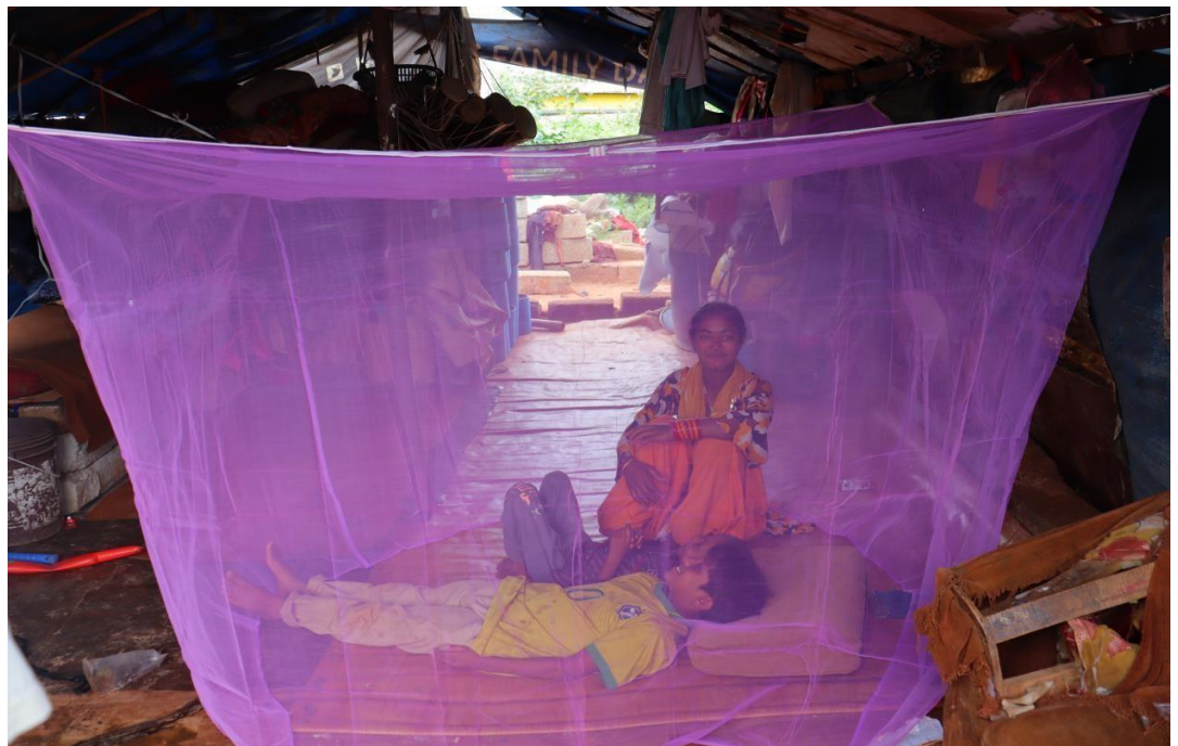
Uitdelen van muggennetten in het beschermt tegen knokkelkoorts en Malaria

We besteden speciale aandacht aan het versterken van vrouwen door hen begeleiding en ondersteuning te bieden om hun positie te verbeteren. We organiseren ook activiteiten over gezondheid & hygiëne, gendergelijkheid, kinderrechten en opvoeding.