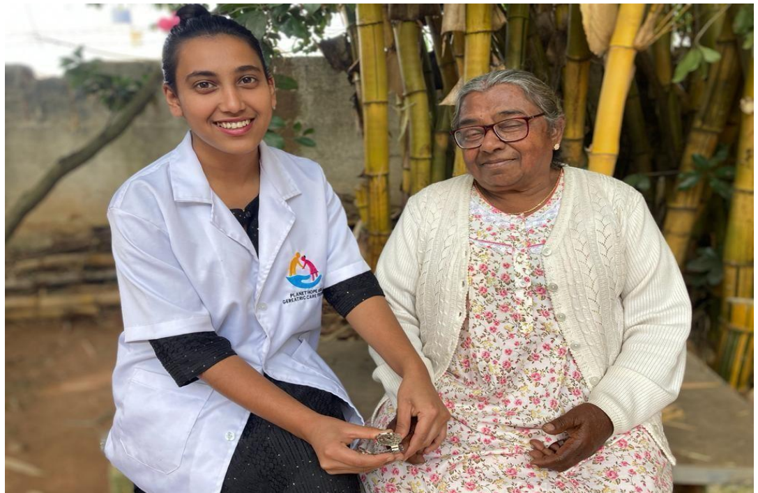
Aan het werk bij Ashley Home Care als professionele ouderenverzorgster

De opleiding besteedt ook aandacht aan het belang van zelfzorg en empowerment van de zorgverleners zelf. Studenten leren hoe ze hun eigen fysieke en mentale gezondheid kunnen bewaken, stress kunnen verminderen en een goede balans kunnen vinden tussen werk en privéleven.