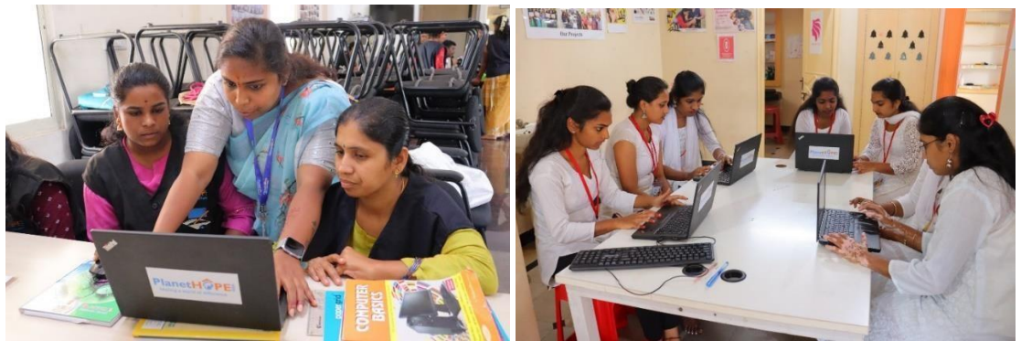
Studenten van de opleiding Tailoring & Entrepreneurship en van de opleiding Beautician krijgen computerlessen

Onze cursussen blijven meisjes helpen om sociale barrières te overwinnen, zelfstandig te worden. We blijven ons inzetten voor hun empowerment en betrekken ouders actief bij het trainingsproces. Dit alles draagt bij aan het versterken van de gemeenschap en het doorbreken van gender-bias en sociale normen.