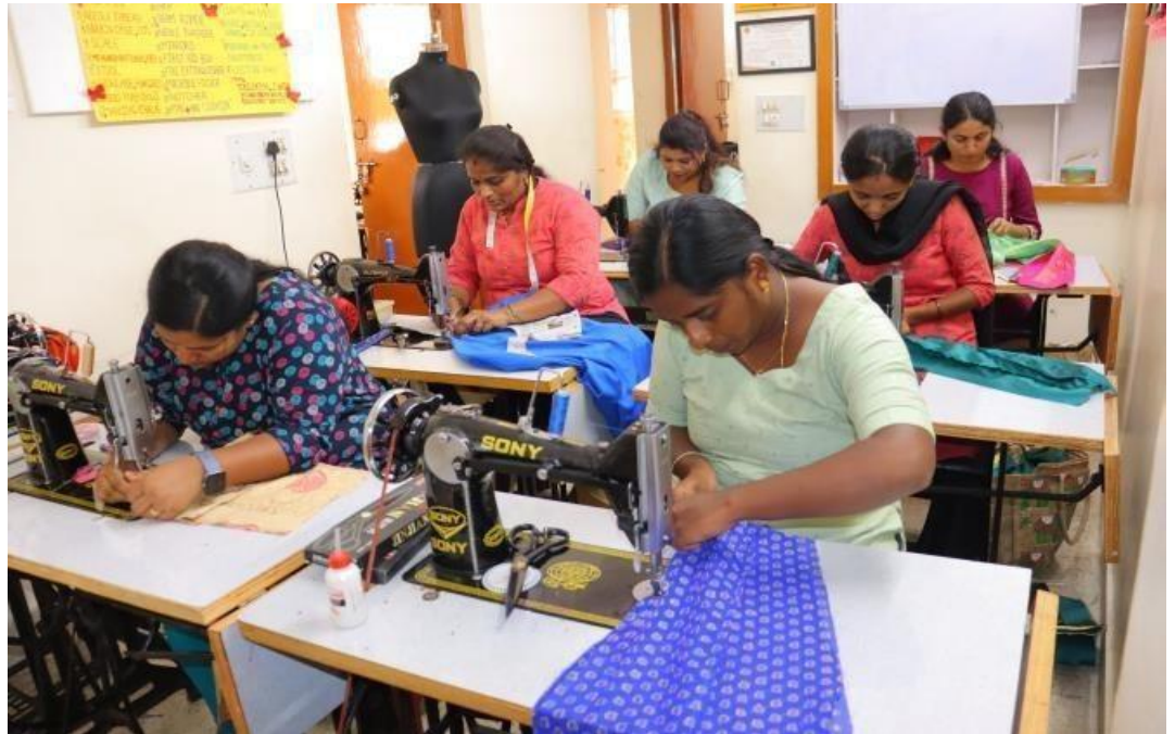
Jurken in verschillende design leren naaien.

De jonge ondernemers hebben in de eerste maanden van hun training prachtige jurken ontworpen en deze zijn beschikbaar in onze webshop. Voormalige studenten die nu zelfstandig ondernemers zijn, delen hun ervaringen en advies met de nieuwe studenten. Daarnaast worden gastlessen georganiseerd door ondernemers uit verschillende sectoren om de studenten te informeren over het opzetten van hun eigen buurtatelier en het aantrekken van klanten.